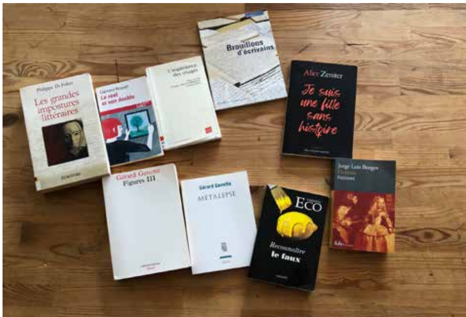
Résidence au Bout du Plongeur, Mai 2023