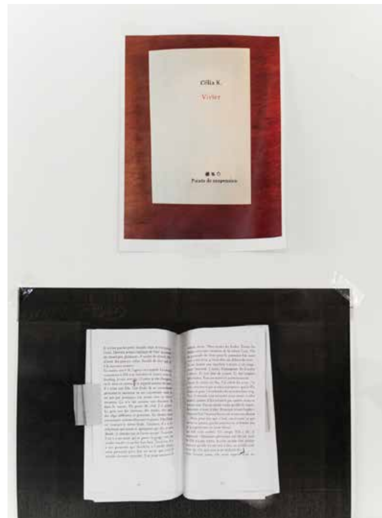
Visuels réalisés lors d'une première étape de travail Ateliers du Vent, 2021

Des auteurs comme Borges ou Di Folco m'accompagnent dans ces recherches. L'ouvrage d'Umberto Eco « Reconnaître le faux », joue un rôle essentiel dans l'écriture du spectacle. L'enjeu est de convoquer des éléments théoriques sur le mensonge, pour donner des clefs et collectivement, ensuite, déceler en pratique ce qui est fictionnel de ce qui ne l'est pas.